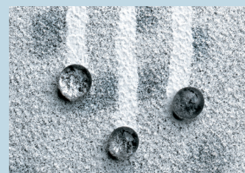
StoLotusan Color G