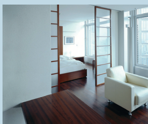
Příklad řešení akustických podhledů v rodinném domě